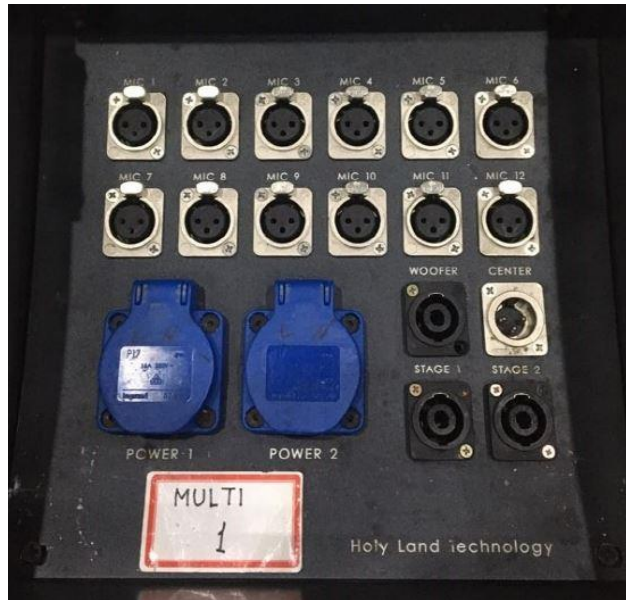
하수 Stage Box